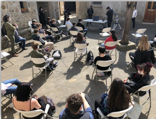
Opération scanner de Saint Esteve sur la place