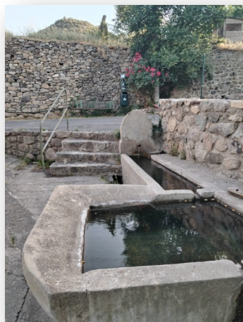
Fontaine du Cami d'En Paroll. 1933