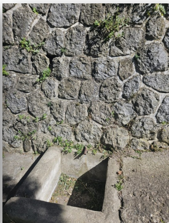
Fontaine du Serradet