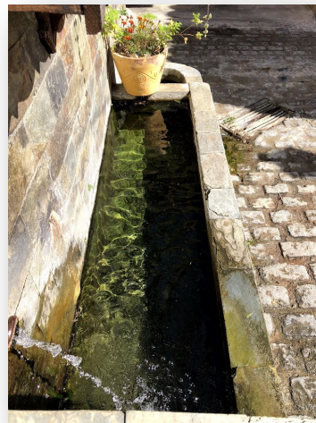
La pile de la Place. 1800

La fontaine de la Pile conserve d'ailleurs une place particulière dans le quotidien de certains habitants, qui continuent à venir y remplir bouteilles et bidons, perpétuant ainsi une tradition ancienne. Il convient toutefois de rappeler que cette eau ne fait actuellement l'objet d'aucun contrôle sanitaire régulier.