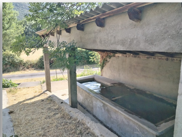
Le lavoir communal de dellà l'Aigua. 1955

Mairie ouverte Mer/ Sam de 9 à 12h - tel : 0468050213 - mail : mairiedecampome@orange.fr